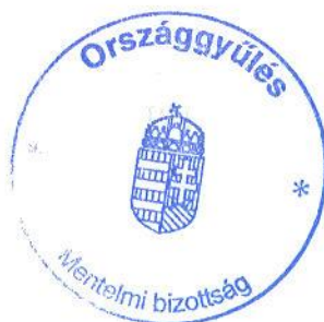
..... Mentelmi bizottság munkatársa átvevő