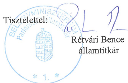
Rétvári Bence államtitkár