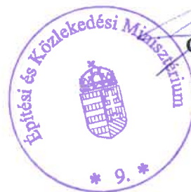
Csepreghy Nándor Csepreghy Nándor miniszterhelyettes