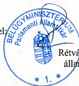
Rétvári Bence államtitkár