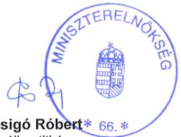
Zsigó Róbert* 66.* államtitkár