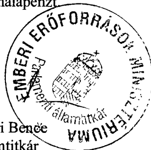
Rétvári Benő államtitkár