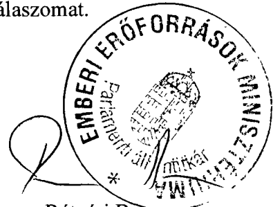
Rétvári Bence államtitkár