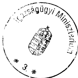
Dr. Trócsányi László h.