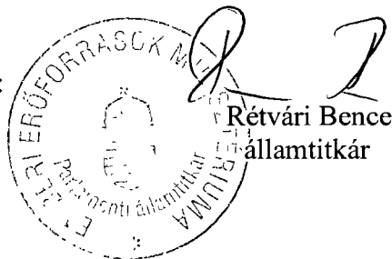
Rétvári Bence Államtitkár