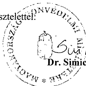
Dr. Simicskó István