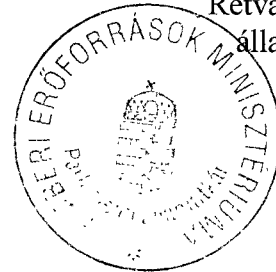
Rétvári Bence államtitkár