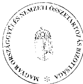
Pánczél Károly a bizottság elnöke