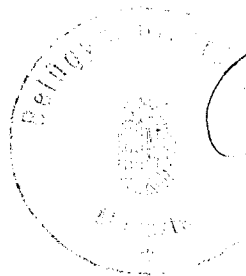
Dr. Pintér Sándor belügyminiszter