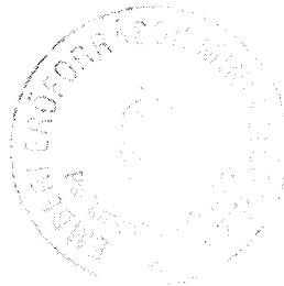
Rétvári Bence államtitkár