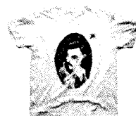
Petőfi Sándor Mens...