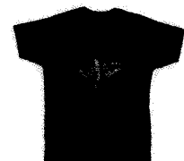
Late Sparrow Berlin...