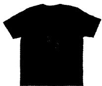
Satan Little Helpers...