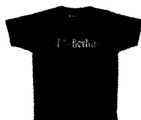
Love / Hate Berlin Men...