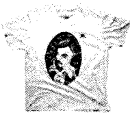
Petőfi Sándor Mens...