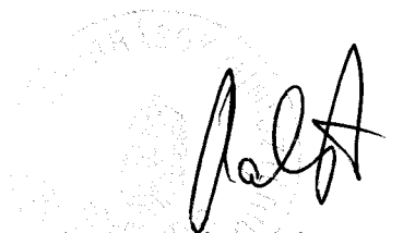
Balog Zoltán emberi erőforrások minisztere