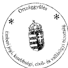
Balog Zoltán a bizottság elnöke