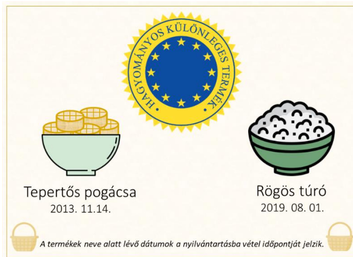
1. ábra: Nyilvántartott hagyományos és különleges termékek Magyarországon

A földrajzi árujelzőkön túl az úgynevezett hagyományos különleges termékek (HKT) is az Európai Unió minőségrendszeréhez tartoznak. A hagyományos különleges termék (HKT) megjelölés olyan termékeket illet, amelyek hagyományos összetétellel, vagy hagyományos előállítással illetve feldolgozással készülnek. A HKT elnevezés nem védjegy, és nem földrajzi árujelző. Csak az adott termék hagyományos használt neve jegyezhető be hagyományos termékként, amely elnevezés védelmet élvez bármely, a fogyasztók megtévesztésére alkalmas gyakorlattal szemben ( Szomi 2022).