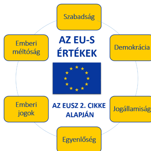
1. ábra: Az Európai Unió alapértékei