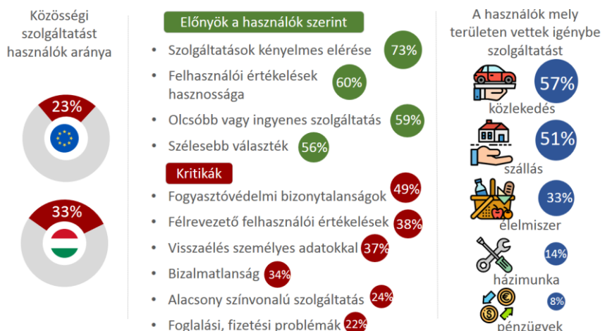
1. ábra: Adatok a közösségi gazdaság használatáról az EU-ban

A közösségi gazdasághoz és a technológiai változásokhoz alkalmazkodva a hagyományos munkavállalás mellett egyre többféle, új munkavállalási forma jelenik meg. Az OECD 2019-ben e témában készített jelentése , hat új típusú munkavégzési formát különböztet meg.