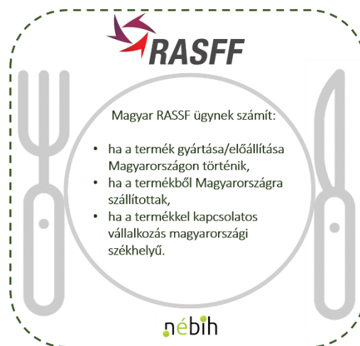
3. ábra: A magyar RASFF ügy feltételei

Nébih külön feltünteteti oldalán . A Magyarországot is érintő legfrissebb statisztikák a RASFF 2018-as éves jelentéséből érhetőek el ( RASFF, 2018 ).