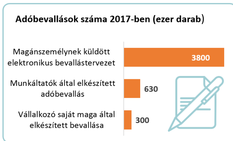
2. ábra: Adóbevallások