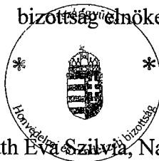
Lázár János a Honvédelmi és rendészeti bizottság elnöke