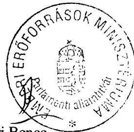
Rétvári Bence államtitkár