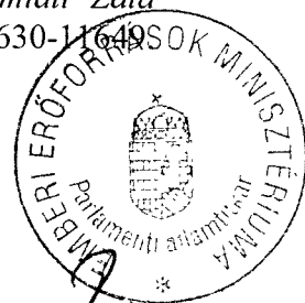
Rétvári Bence államtitkár