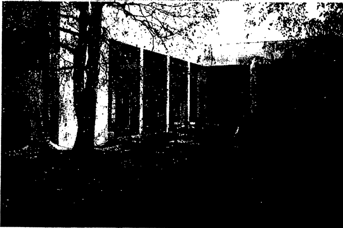
Egy hónap és átadják az új létesítményt

A polgármester így folytatta: a kölcsön fedezetét az jelenti, hogy egy év alatt 60 millió forintot takarított meg az önkormányzat. Átvilágították az intézmények működését, tovább új szolgáltatótól kapták a gázt. Ez utóbbi 10 millió forint megtakarítást jelent. A város saját maga működteti az iskoláját, az pedig 15 millió forinttal kevesebb kiadást jelent.