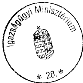
Dr. Trócsányi László h.