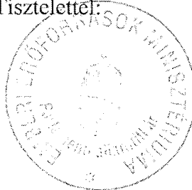
Rétvári Bence államtitkár