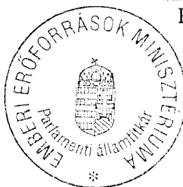
Rétvári Bence államtitkár