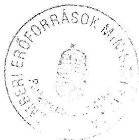
Rétvári Bence államtitkár