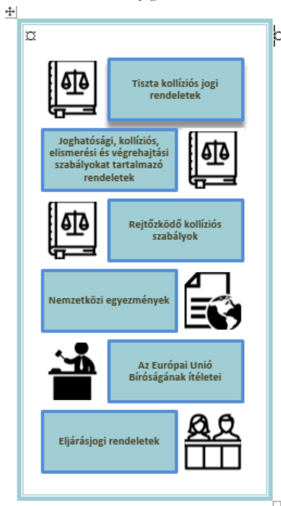
1. ábra: EU-jogforrások