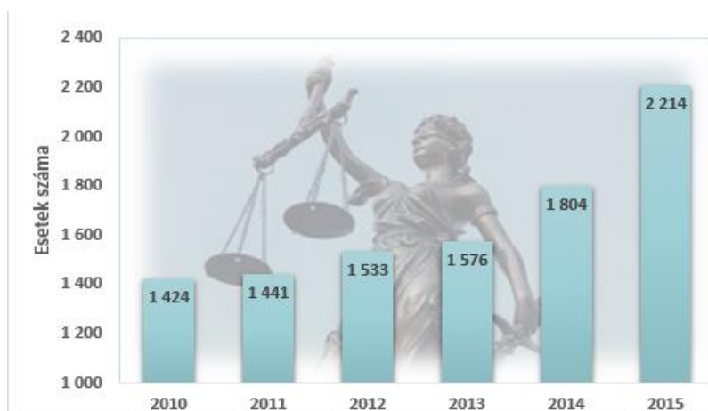
1. ábra: Eurojust: vizsgált esetek száma (2010-2015)

A testület nem kötelező erejű véleményeket fejt ki azokban az esetekben, amikor két vagy több tagállam nem tudja megoldani a joghatósági összeütközéseket, vagy ha az illetékes hatóságok az igazságügyi együttműködéssel kapcsolatos nehézségekről számolnak be.